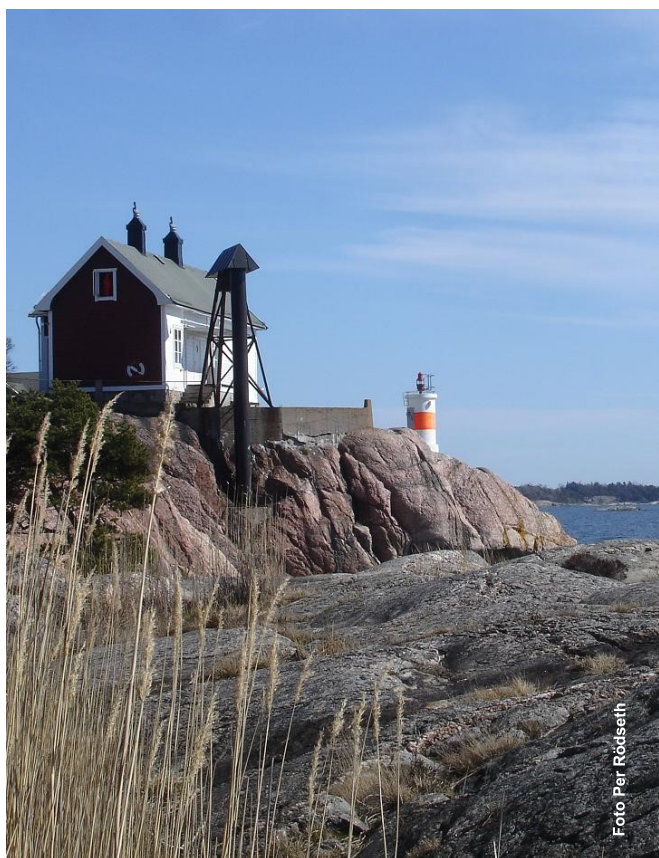
Fyrvaktarbostaden på Femörehuvud

Museet drivs av Föreningen Femörefortet. På Femörehuvud, där fortet ligger, finns även Fyrvaktarbostaden, som föreningen hyr ut för övernattningar, konferenser, fester med mera. Hela halvön är ett naturreservat. Från Sörmlandsledens stigar kan man uppleva naturen och de delar av fortet som är synliga ovan jord.