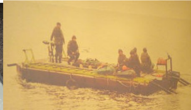
Utläggning från flotte