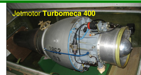
Jetmotor Turbomeca 400

Föreningen Femörefortet Oxelösund www.femorefortet.se